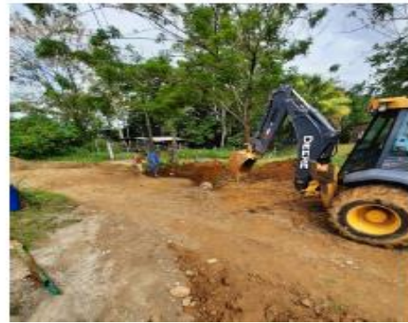
CAMINO 2-10-0813, CALLE GONZALEZ, MONTECRISTO DE AGUAS ZARCAS/ CONSTRUCCION DE EVACUACION PLUVIAL. / CONSTRUCTORA HERRERA S.A. / OC. 13635-1