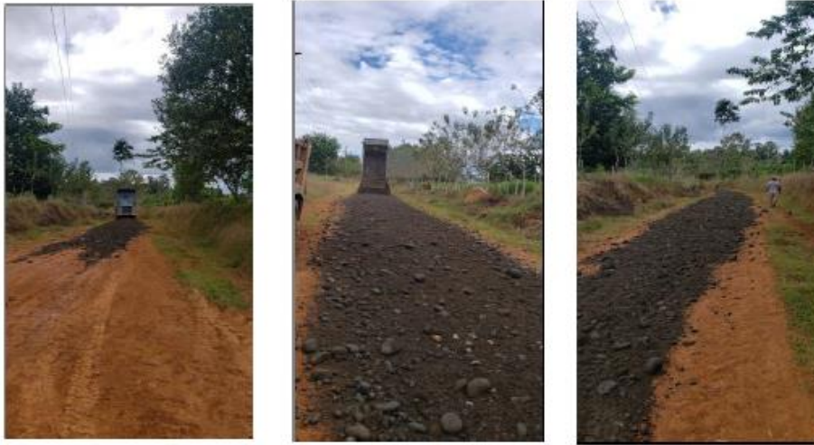
FOTOS DEL TRABAJO CAMINO N° 2-10-0203

1 2 3 4 5 6 7 8 9 10 11 12 13 14 15 16 17 18 19 20 21 22 23 24 25 26 27 28 29 30