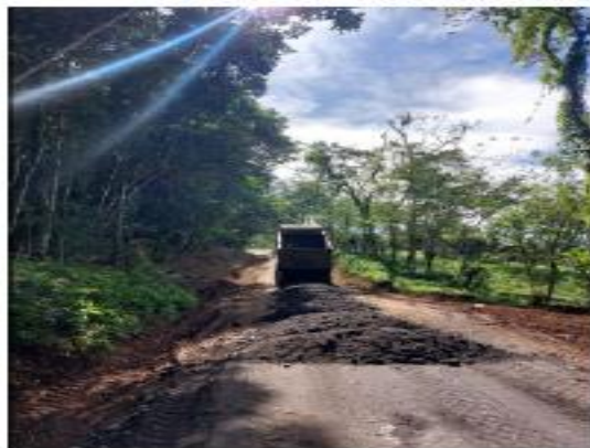
CAMINO N° 2-10-895