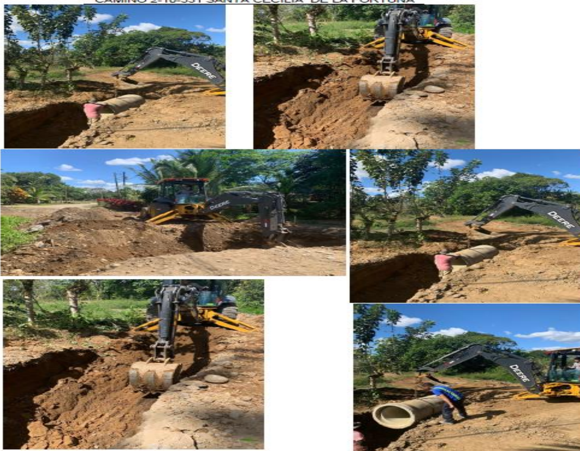
CAMINO 2-10-531 SANTA CECILIA DE LA FORTUNA

1 2 3 4 5 6 7 8 9 10 11 12 13 14 15 16 17