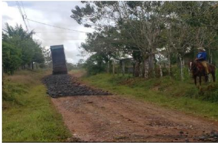
FOTOS DEL TRABAJO CAMINO N° 2-10-0324