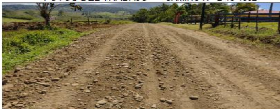
CAMINO N° 2-10-1062