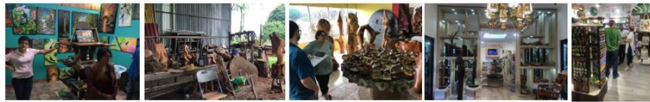
Fase 1 Mapeo de demanda de hoteles y tiendas de La Fortuna [2019]