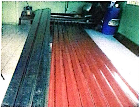
Salón Comunal Baltazar, Ciudad Quesada.