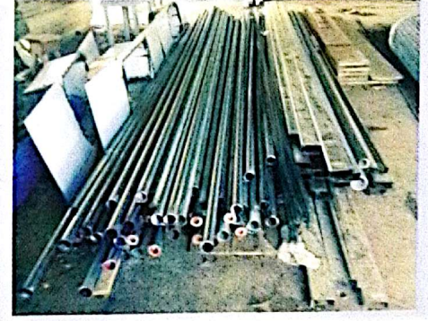
Cocina comunal San Vito, Cutris.