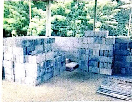
Cocina comunal El Ceibo, Venecia.