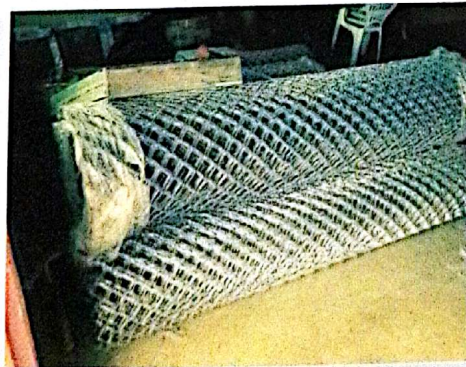
Escuela El Encanto, Pital.