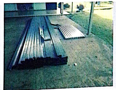
Escuela La Unión, Monterrey.