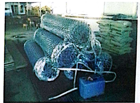
Cancha deportiva Jicarito, Venado.