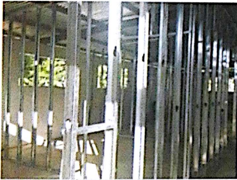
EB AIS Castelmare, Cutris.