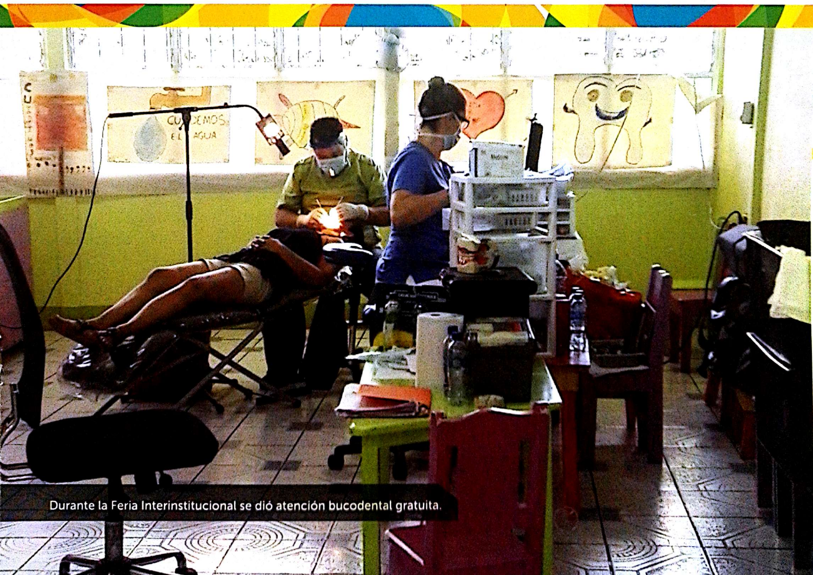
Durante la Feria Interinstitucional se dió atención bucodental gratuita.

Entre las 30 instituciones públicas participantes estuvieron la Municipalidad de San Carlos, Ministerio de Salud, Fuerza Pública, Cruz Roja Costarricense, Tribunal Supremo de Elecciones, Migración y Extranjería, Acueductos y Alcantarillados, Instituto Mixto de Ayuda Social, entre otros.