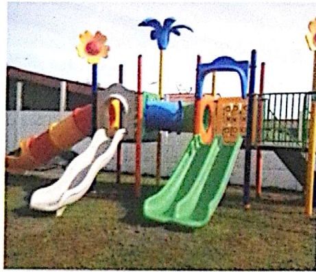
Parque Infantil Calle Morales, Aguas Zarcas.

La inversión en obras comunales se traduce en entrega de materiales como: blocks, cemento, perling, mallas, zinc, arena, piedra, entre otros. De esta manera ayudamos a las comunidades en el mejoramiento de diferentes instalaciones como: deportivas, centros educativos, cocinas comunales, parques infantiles, EB AIS en beneficio de los pobladores.