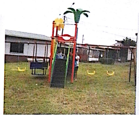
Parque Infantil Urbanización Bella Vista, Ciudad Quesada.