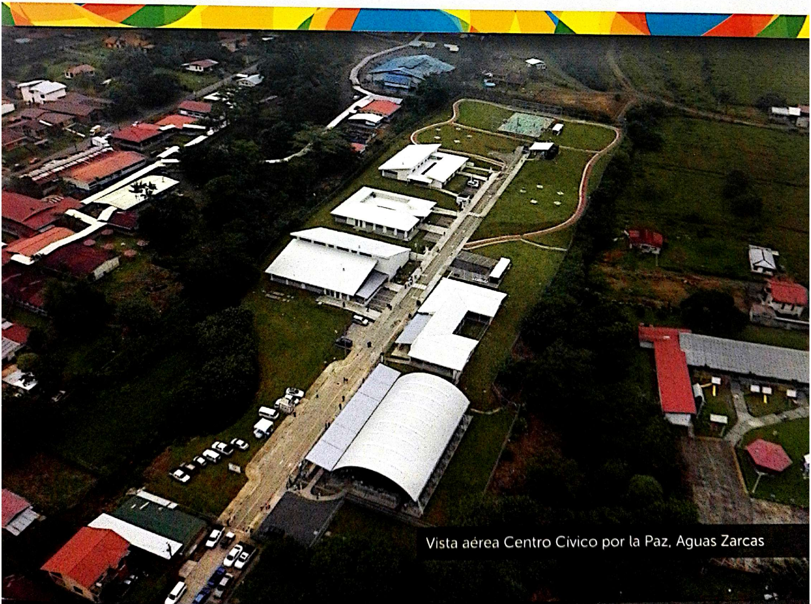
Vista aérea Centro Civico por la Paz, Aguas Zarcas