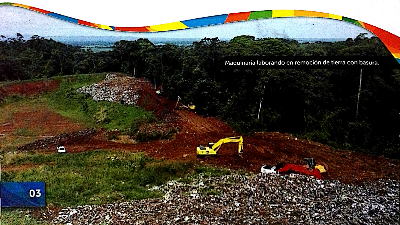
Maquinaria laborando en remoción de tierra con basura.

Dichos productos son utilizados para la impermeabilización del suelo y evitar la contaminación con los lixiviados de la basura. Su colocación está contratada en ese proceso y serán las últimas acciones a ejecutar para que la trinchera entre en funcionamiento.