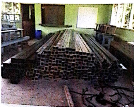
Salón Comunal San Pedro, Cutris.