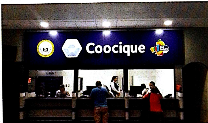
Se habilitaron tres ventanillas de Cooquite en el Palacio Municipal.

De esta forma se podrán realizar los pagos de los trámites de impuestos, sin cargo alguno, en cualquiera de las tres cajas habilitadas en el primer piso del edificio de la Municipalidad.