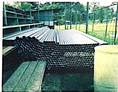
Cancha deportiva El Tanque, Fortuna.