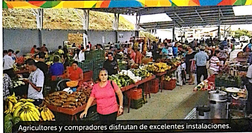
Agricultores y compradores disfrutan de excelentes instalaciones.

La obra costó más de 97 millones de colones , mide 517 metros cuadrados y se construyó con aporte de la Municipalidad de San Carlos, del Consejo Nacional de Producción (CNP) y del Ministerio de Agricultura y Ganadería (MAG).