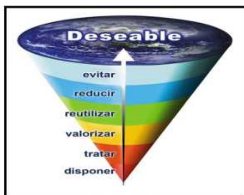
Imagen N.º 1 Jerarquización para la gestión de los residuos

1.16. La ley en referencia, identifica al Ministerio de Salud como el ente rector en materia de gestión integral de residuos y le asigna a los gobiernos locales una serie de obligaciones, atribuciones y responsabilidades para asegurar una gestión integral de residuos.