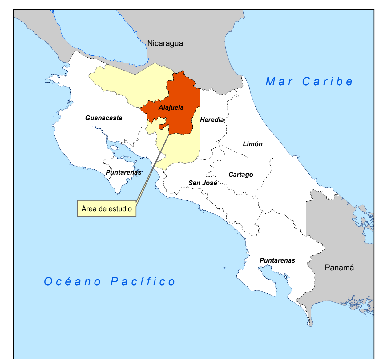
MATRIZ DE INFORMACIÓN DE VALORES DE TERRENOS POR ZONAS HOMOGÉNEAS PROVINCIA 2 ALAJUELA CANTÓN 10 SAN CARLOS DISTRITO 13 POCOSOL