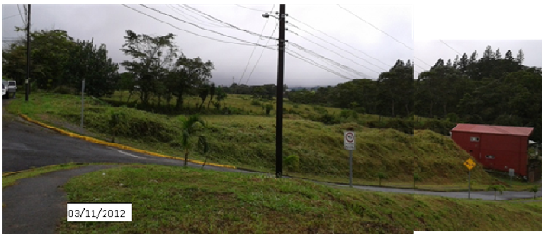
TERRENO EN EL MES DE SETIEMBRE 2012