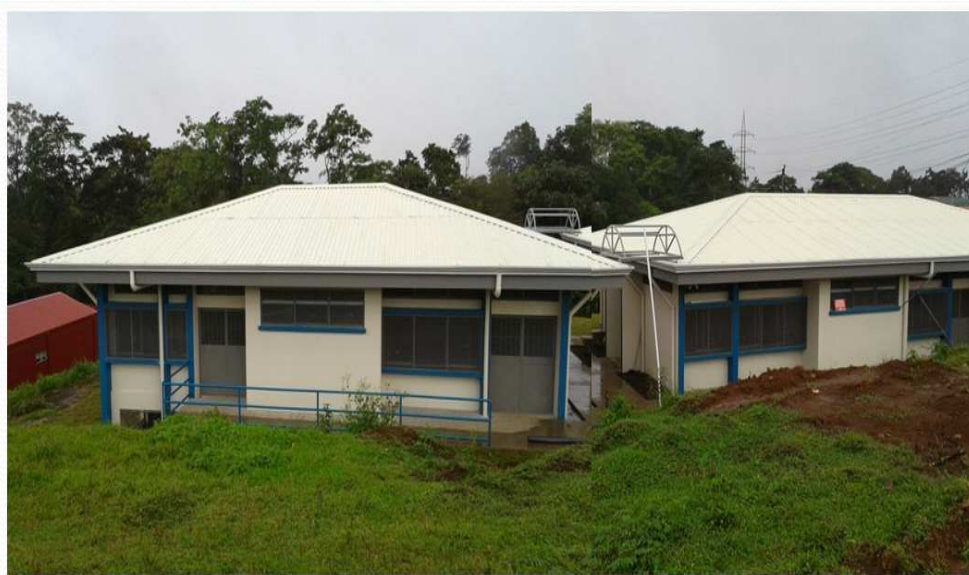
VISTA POSTERIOR DE LOS EDIFICIOS