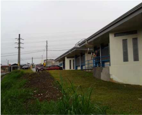
VISTA DESDE COSTADO NOROESTE