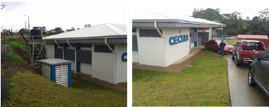
TERRENO Y EDIFICACIONES EN EL MES DE SETIEMBRE 2013