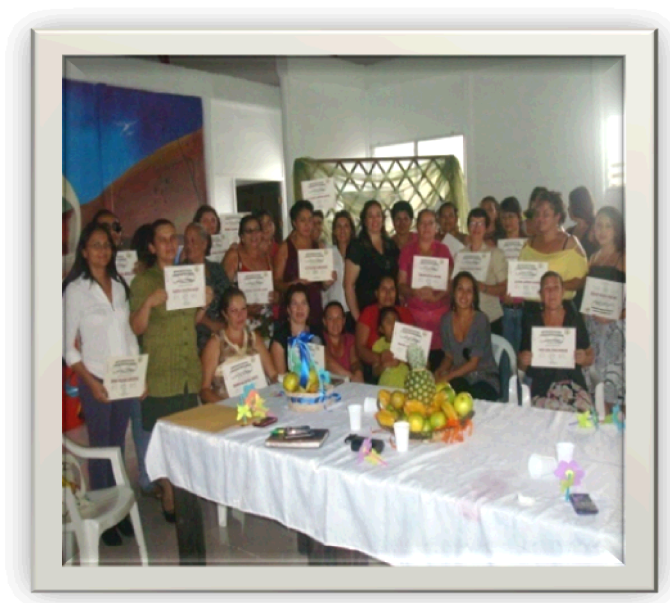
II Grupo de Mujeres Microempresarias 2011