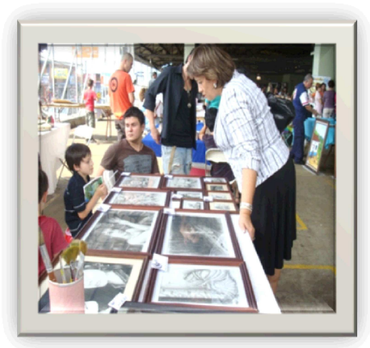
Plazoleta del mercado municipal Ciudad Quesada