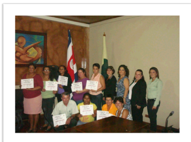
Alfabetización digital Ciudad Quesada