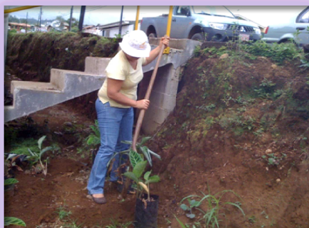
Paisajismo. Edificio Barrio El jardín