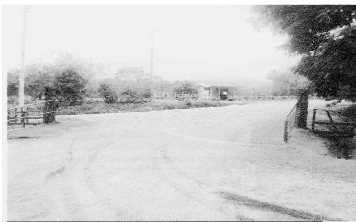
Foto 1. Vista desde la entrada de uso público del PNVA

Le estamos insertando fotos de lo que poseen en este momento para mejor decidir.