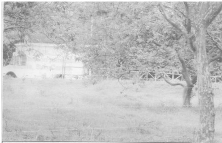
Foto 3. Vista trasera de la infraestructura construida