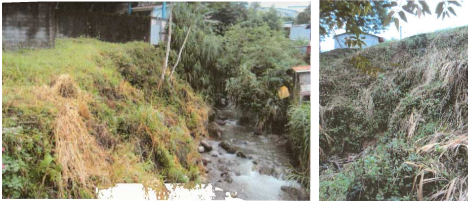
Pendientes y guindos expuestos

Es urgente considerar el estado de erosión del terreno en el área de piscina, cuyas paredes presentan importantes grietas, sumando al invierno actual, se correría riesgo de sufrir pérdidas mayores.