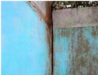
Grietas existentes en paredes área de piscina

Es urgente considerar el estado de erosión del terreno en el área de piscina, cuyas paredes presentan importantes grietas, sumando al invierno actual, se correría riesgo de sufrir pérdidas mayores.