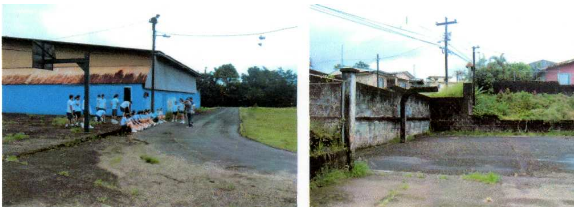
Estado actual de la cancha

El área de planché, donde se ubican las canchas de básquet, se encuentra en mal estado, la superficie esta llena de huecos, lo que no facilita la práctica del deporte. Los jóvenes no encuentran un lugar apropiado para la recreación.