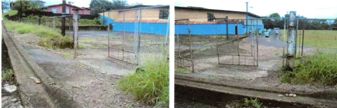
Acceso actual al Maracaná

A nivel de acceso no se cuenta con aceras, ni rampas para personas adultas mayores o con discapacidad