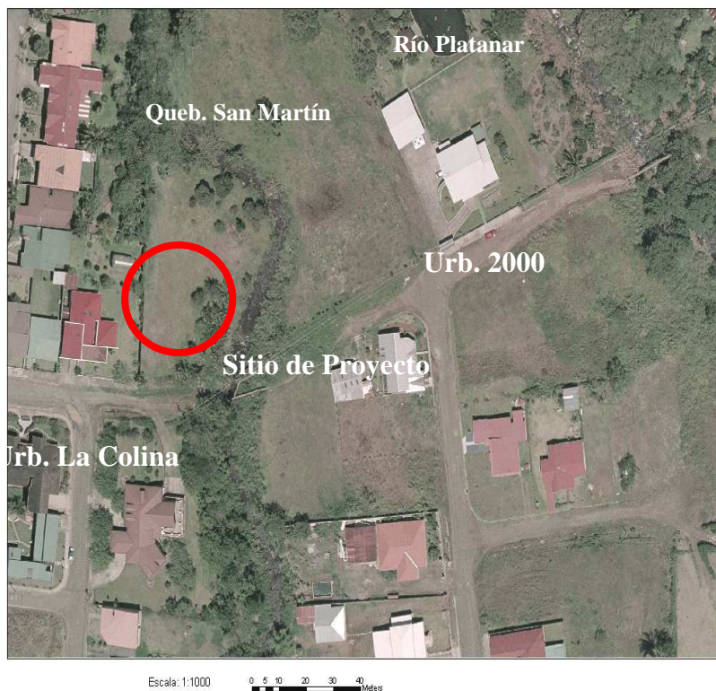
Fotografía 1. Vista aérea del sitio de proyecto