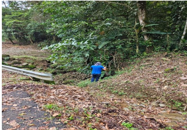
Anexo #2: Evidencia de corta previa por emergencia de vientos y lluvia.

1 2 3 4 5 6 7 8 9 10 11 12 13 14 15 16 17 18 19 20 21 22 23 24 25 26 27 28 29 30