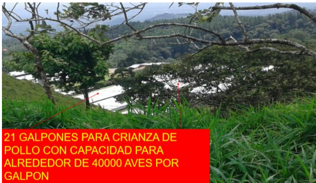
21 GALPONES PARA CRIANZA DE POLLO CON CAPACIDAD PARA ALREDEDOR DE 40000 AVES POR GALPON

1 2 3 4 5 6 7 8 9 10 11 12 13 14 15 16 17 18 19 20 21 22 23 24 25 26 27 28 29 30