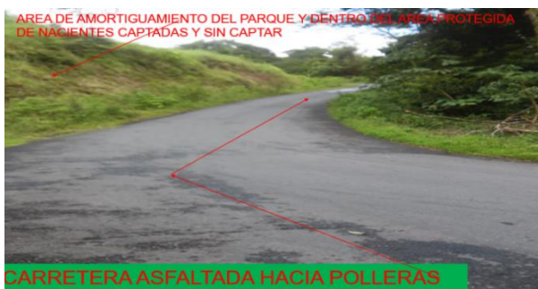
AREA DE AMORTIGUAMIENTO DEL PARQUE Y DENTRO DEL AREA PROTEGIDA DE NACIENTES CAPTADAS Y SIN CAPTAR