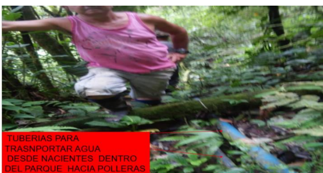
TUBERIAS PARA TRANSPORTAR AGUA DESDE NACIENTES DENTRO DEL PARQUE HACIA POLLERAS