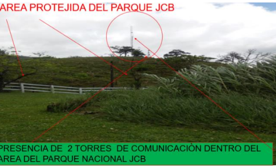
AREA PROTEJIDA DEL PARQUE JCB