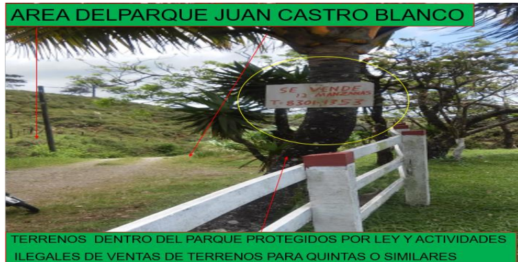
AREA DEL PARQUE JUAN CASTRO BLANCO