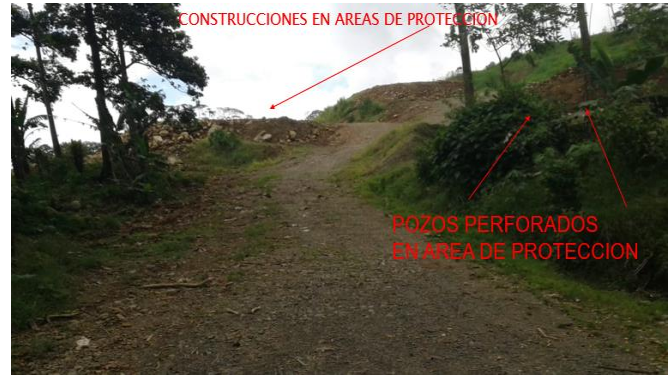
CONSTRUCCIONES EN AREAS DE PROTECCION