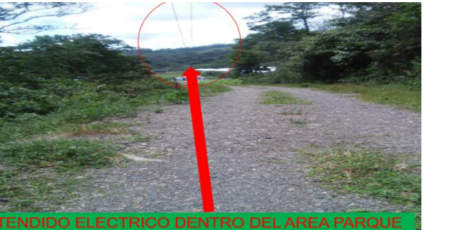
TENDIDO ELECTRICO DENTRO DEL AREA PARQUE