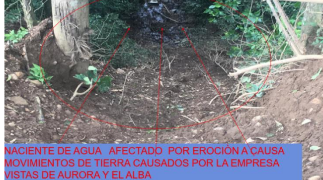
NACIENTE DE AGUA AFECTADO POR EROSION A CAUSA MOVIMIENTOS DE TIERRA CAUSADOS POR LA EMPRESA VISTAS DE AURORA Y EL ALBA