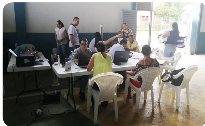
Atención de trámites distrito Pocosol