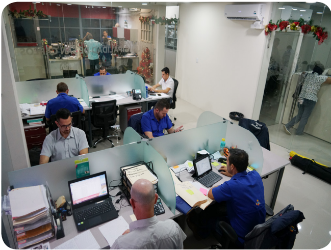
Unidad Técnica de Gestión Vial Municipal

La Municipalidad de San Carlos inició un proceso de mejora y reestructuración de oficinas y cubículos de varios departamentos, remodelaciones que permiten dar una mejor atención y servicio a nuestros contribuyentes.