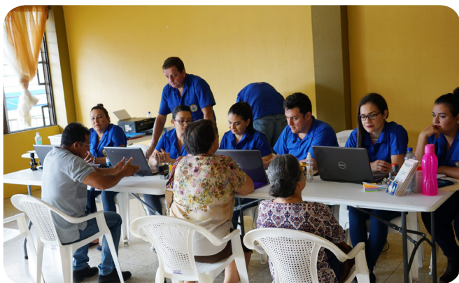
Atención de trámites distrito Pital

El Gobierno Local ha llevado sus trámites a Pocosol, Pital, Cutris, Monterrey y Venado, lugares en donde se han realizado más de 1300 trámites municipales de diversa índole.