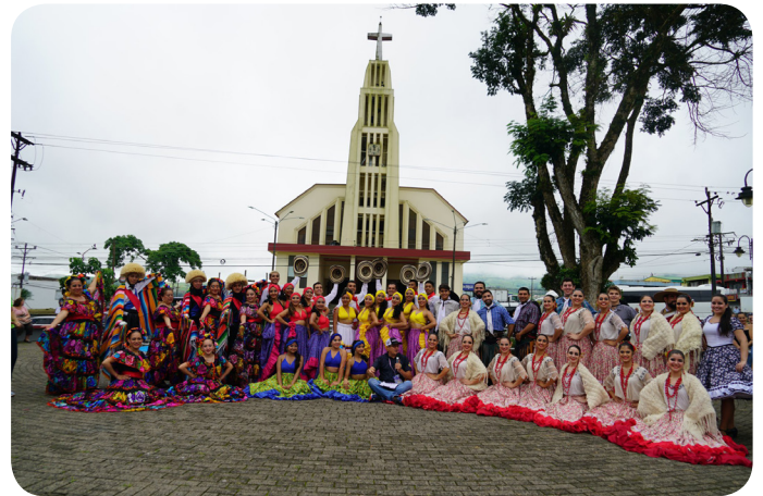
Festival Internacional Municipal del Folclor