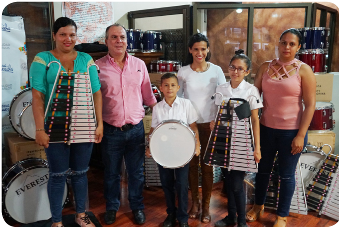
Entrega instrumentos musicales

Entre las actividades producidas y apoyadas, destaca el Primer Festival Internacional Municipal del Folclor San Carlos Mi Linda Tierra, Velada Artística San Carlos 2018, Festival Navideño 2018, Celebración de las Tradiciones Sancarleñas, Desfile de Boyeros de Venecia, entre muchas otras.