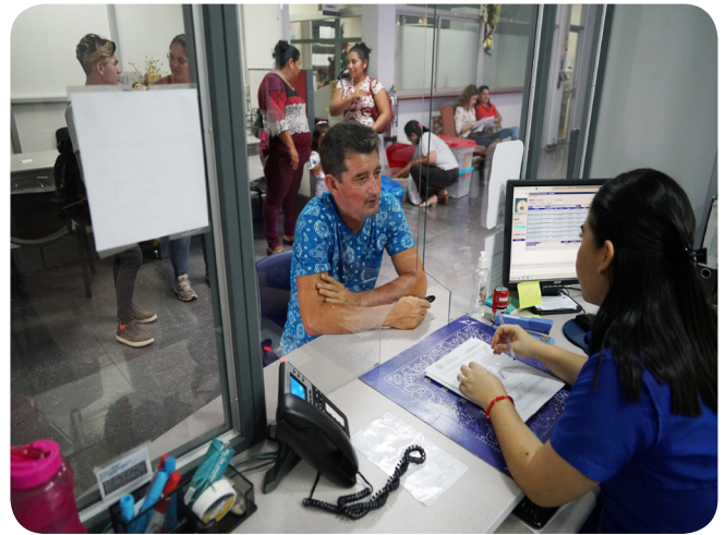
Plataforma de Servicios e Información

En cuanto al Plantel Municipal, se instalaron nuevos estantes industriales, lo que permite