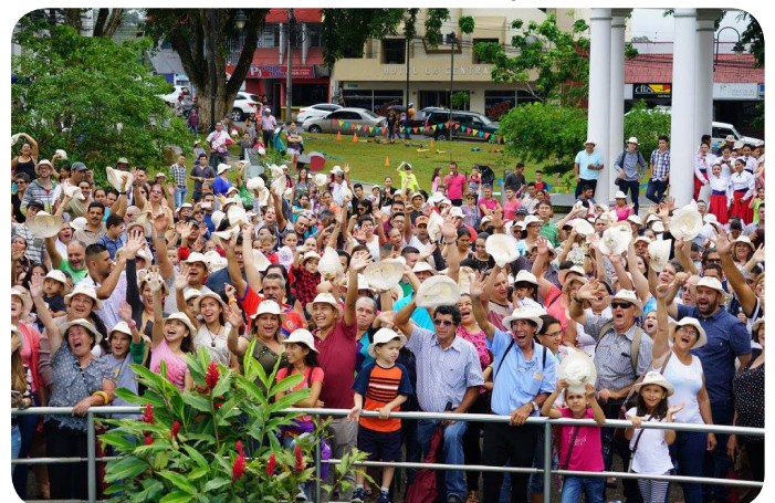
Celebración Tradiciones Sancarleñas