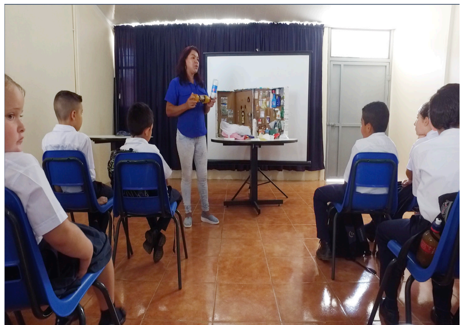
Estudiantes aprenden a dar buen uso a residuos valorizables

en diferentes localidades, y se realizaron 12 charlas, 1344 capacitaciones y cinco ferias ambientales.