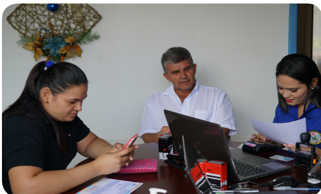
Atención de trámites distrito Boca Arenal