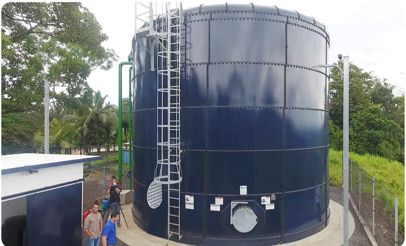
Tanque de captación acueducto de Florencia

Como parte de los trabajos de edificación del tanque, que es de acero vitrificado con capacidad de 500 metros cúbicos de almacenamiento, se construyó la captación de la naciente, se colocó línea de tubería de conducción y se hicieron mejoras en líneas de distribución