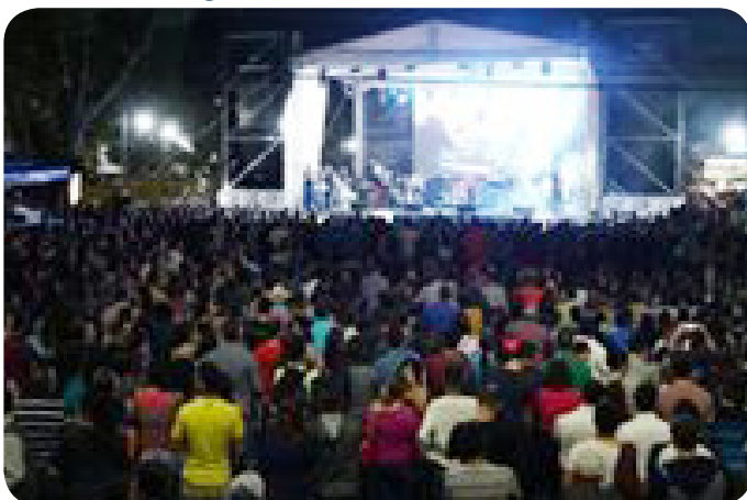
Velada artística, Malpais