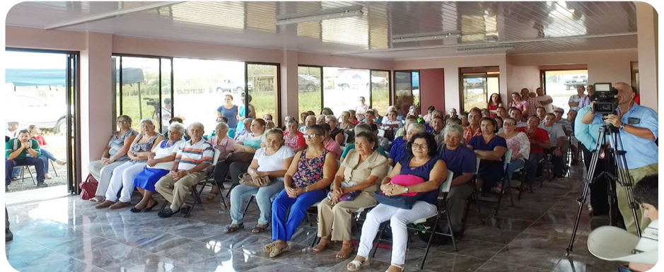
Inauguración Centro de Atención al Adulto Mayor, La Tigra

De esta forma, el Gobierno Local mantiene firme su compromiso de apoyar e impulsar el mejoramiento de la calidad de vida de la población adulta mayor del cantón.