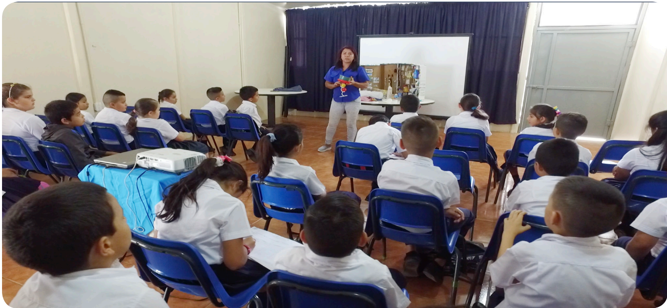
Capacitación estudiantes Escuela Cedral

Las capacitaciones se basan en el buen manejo de los residuos sólidos, como plástico, vidrio, papel, aluminio, hojalata y cantón, y la buena disposición que se le debe dar a cada uno de estos.