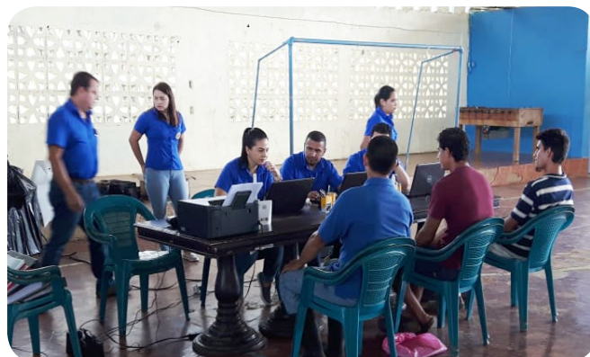
Atención de trámites Coopevega