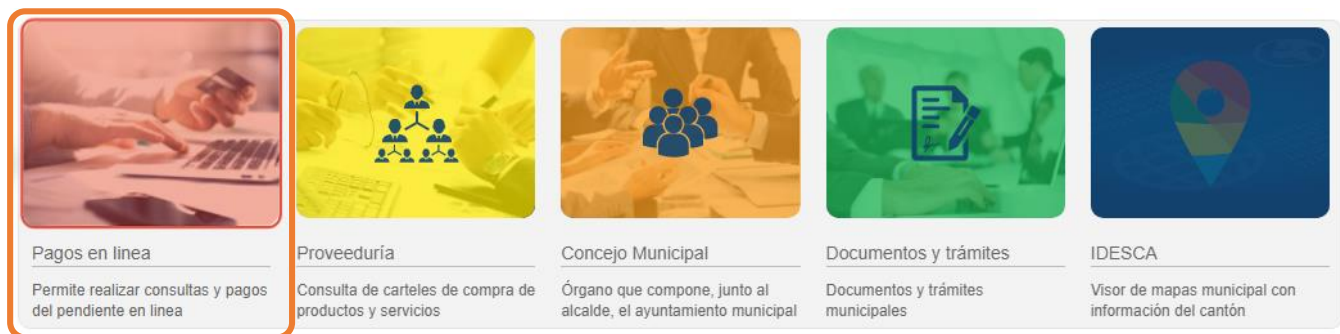
Figura Nª. 2. Barra de accesos rápidos.

En las páginas del sitio web aparece una barra de accesos rápidos con las referencias a las funcionalidades más importantes, entre las opciones está “Pagos en línea”, en la siguiente figura se muestra dicha barra con la opción enmarcada en un recuadro rojo.