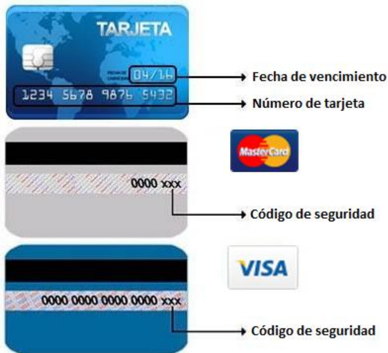
Figura N o . 11. Información de la tarjeta bancaria.

A continuación, en la siguiente figura se muestran los datos a utilizar de la tarjeta bancaria.